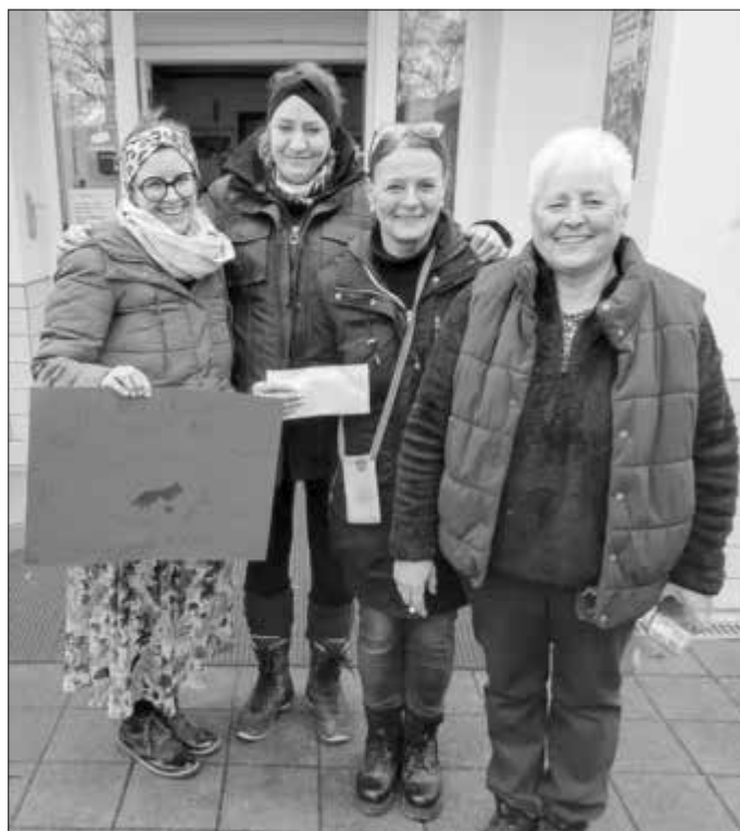
Wald- und Erlebniskindergarten Willersdorf

Ein herzliches DANKESCHÖN an alle, die zum guten Gelingen unseres Martini-Marktes am 15. November 2025 beigetragen haben. Aus unserem Erlös wurden 200 Euro an das Tierheim Forchheim gespendet.